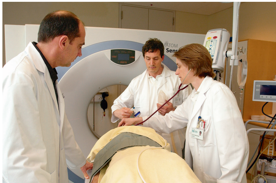
Cumplexsiva ed exacta: la pli nova tecnica en la radiologia permetta da far entaifer curt temp ina diagnosa precisa da las blessuras.