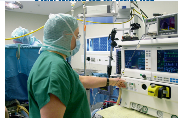
Adina sut controlla: las funcziuns vitalas vegnan controlladas minuziusamain durant l'operaziun.

spustaments ed il ristg da blessuras supplementaras dal magugl dal dies.